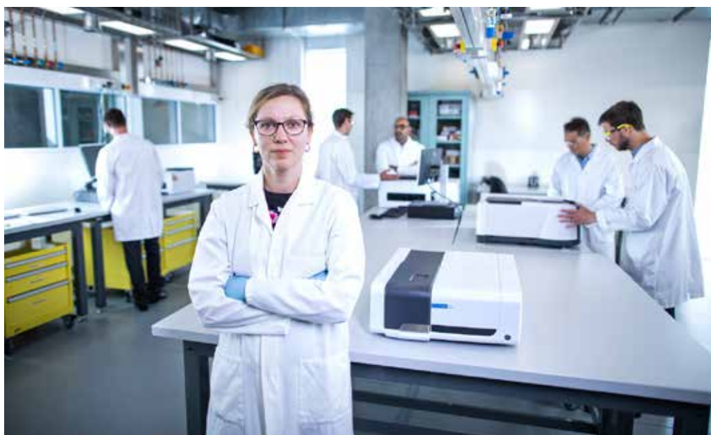
Figura 1. El espectrofotómetro UV-Vis Agilent Cary 60 incluye una garantía de sustitución de 10 años para la lámpara de xenón.

El espectrofotómetro UV-Vis Cary 60 mejora el impacto medioambiental de los laboratorios sin que ello afecte a la productividad o al progreso científico.